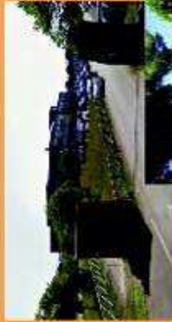
I.I.S.S. "E. Mattei" - Rosignano Solvay

dal 28 ottobre 2003 ospita la copia del primo motore a scoppio di Eugenio Barsanti o Felice Matteucci