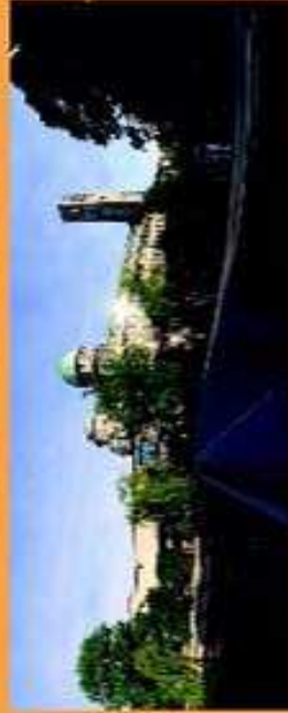
Deutsche Museum - Monaco di Baviera

dal 28 ottobre 2003 ospita la copia del primo motore a scoppio di Eugenio Barsanti o Felice Matteucci