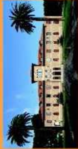
Teatro Ernesto Solvay - Rosignano Solvay

I.T.I.S. meccanica - elettronica - telecomunicazioni I.P.S.I.A. manutenzione dei mezzi di trasporto e impianti