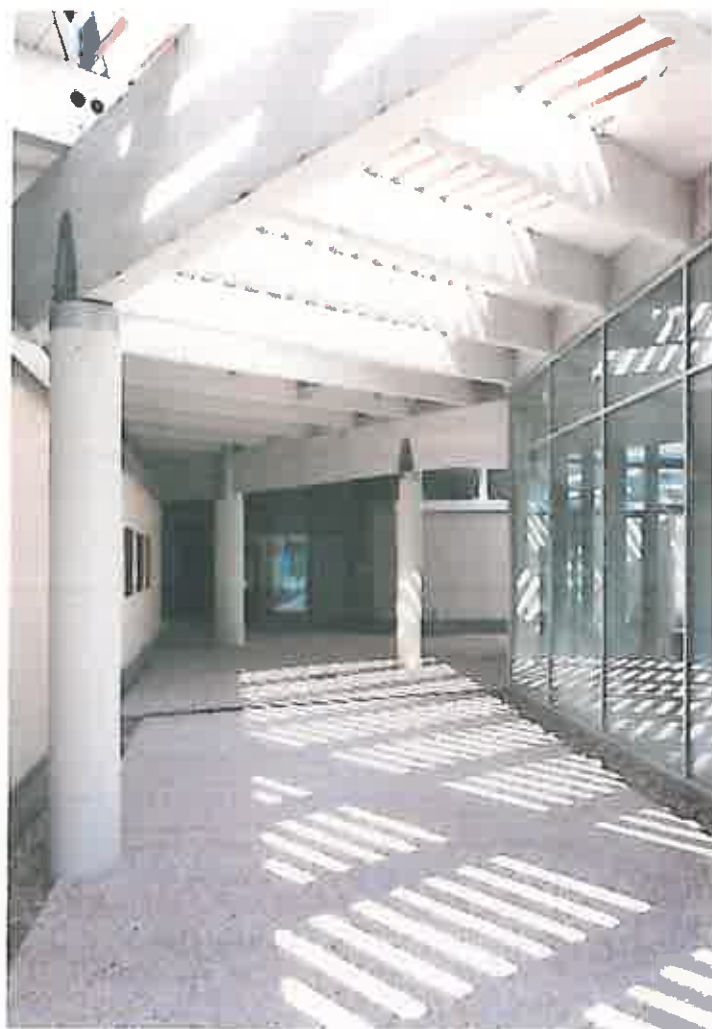
La strada coperta

Le salette di lettura individuale, caratterizzate dalla grafica io studio da solo , utilizzabili anche come zone per l'ascolto, e in alcuni casi come postazioni informatiche individuali, ben rappresentano la forte relazione