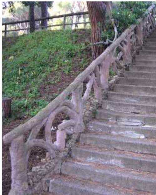
Foto 38-Scale d'accesso Pineta Marrani da Via Aurelia- Ringhiera di Duilio Franceschi