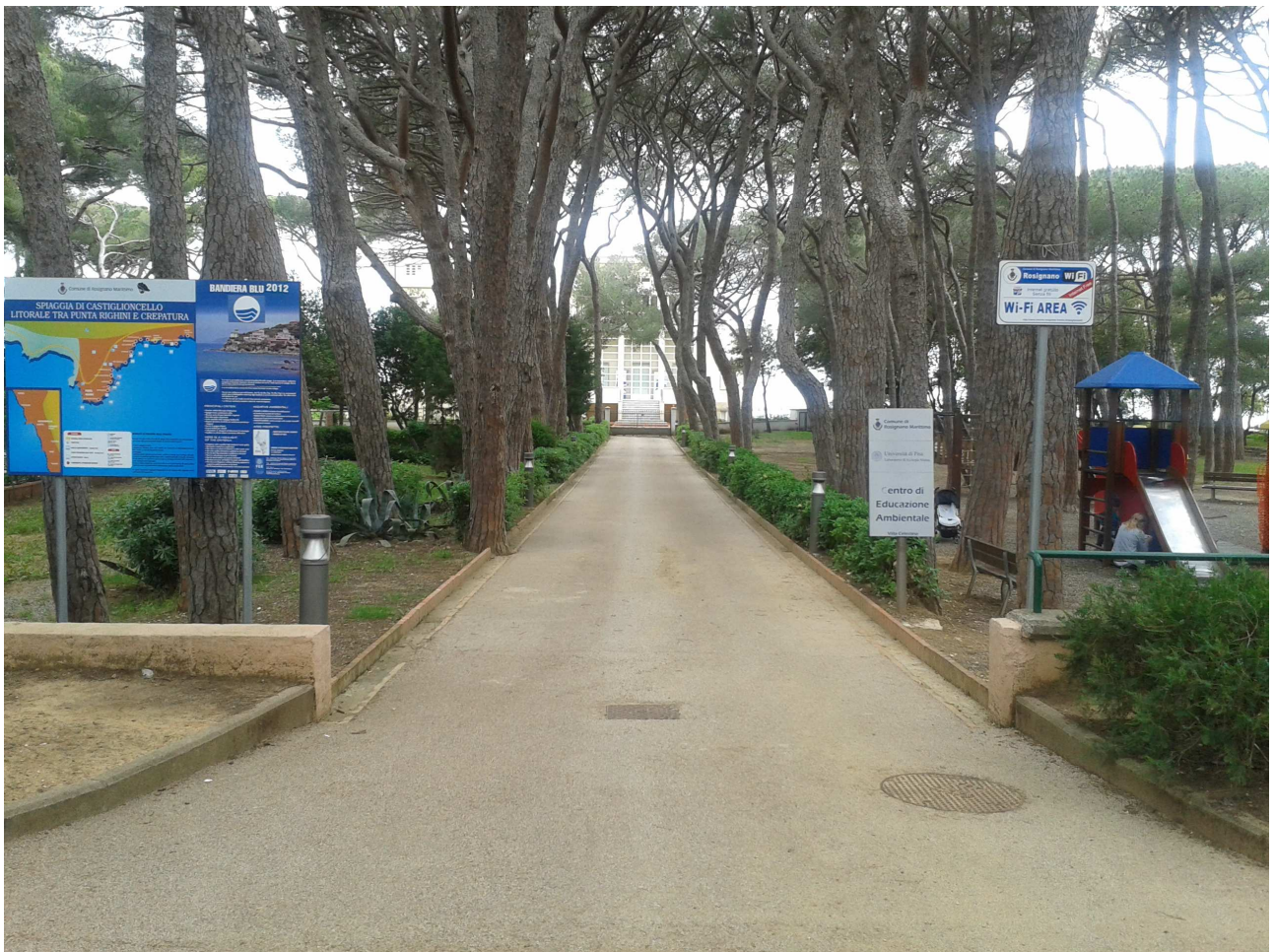
FOTO 39- Viale Accesso Villa Celestina