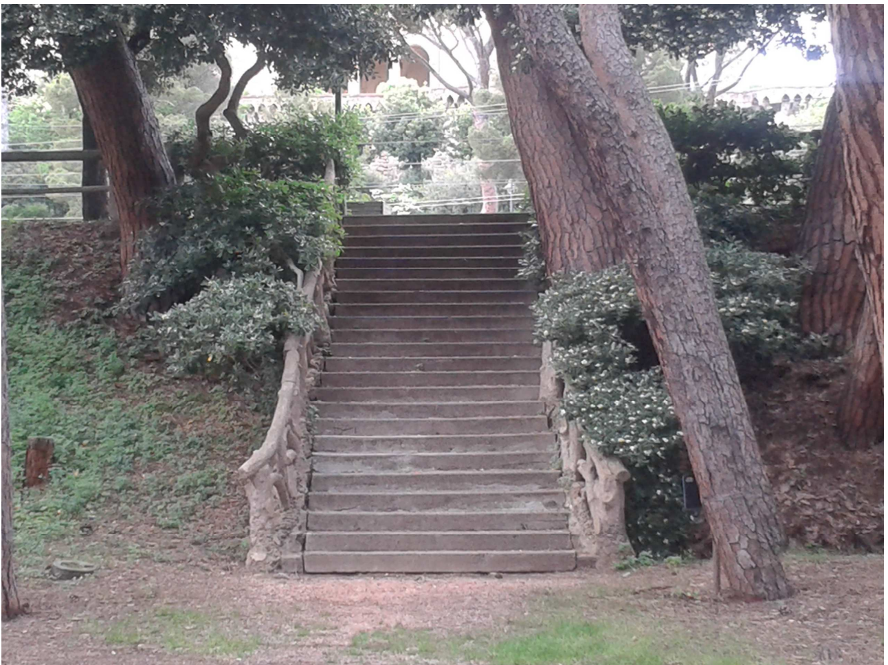
FOTO 36, FOTO 37- Dalla via Aurelia alla Pineta