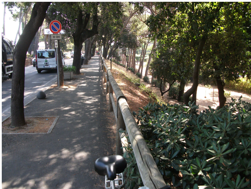
FOTO 24,25,26 La pineta dalla Via Aurelia